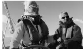
SEGEL TÖRN FREUDE