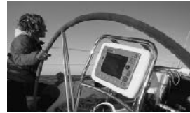
RYA SEGEL KURSE ANERKANNT