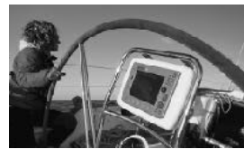
COURS RYA RECONNUS