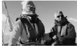
SEGEL TÖRN FREUDE